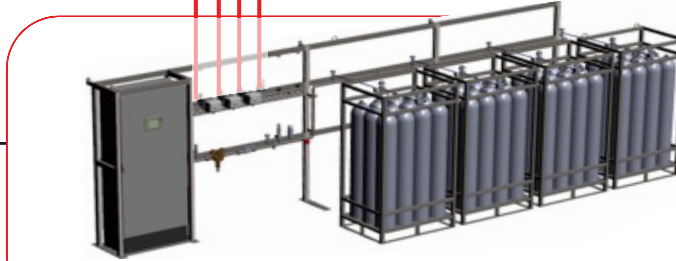
Ventilstation u. N 2 -Hochdruck Flaschenbündel